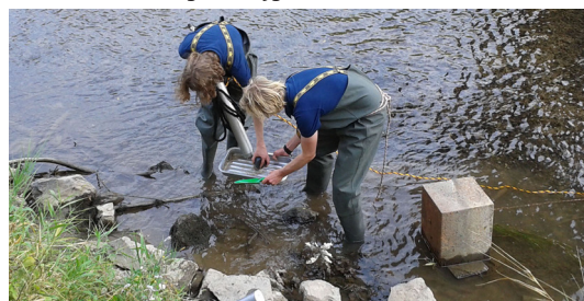
Abb. 4: Ufernahe Sedimentprobenentnahme

Im Zuge des wachsenden wissenschaftlichen Interesses an Mikroplastik in Binnengewässern, finden im direkten Umfeld von Hannover, in Kooperation mit anderen universitären Instituten, Untersuchungen zur Mikroplastikbelastung des Wassers und Sohlensediments in Leine und Ihme statt. Mithilfe eines starken Engagements von studentischer Seite, konnte in ersten Naturmessungen, rund um die Stadt Hannover, mit einem Stechzylinder, Sedimentgreifer und „Mikroplastik-Manta“ die Sohle und Wasseroberfläche beprobt werden. Im weiteren Verlauf der Untersuchung soll die Analyse der Proben, weitere Naturmessungen während unterschiedlicher Abflussregime und laborgestützte Grundlagenforschung erfolgen. Das Ludwig-Franzius-Institut ist dabei vorrangig in den Naturmessungen und Laborversuchen federführend. Basierend auf den hierbei erzielten Ergebnissen soll ein Forschungsprojekt entwickelt und beantragt werden, das in Zusammenarbeit mit den kooperierenden Instituten eine detailliertere Erforschung der lokalen aquatischen Mikroplastikbelastung und deren potenzielle saisonale Fluktuation ermöglicht. [jg]