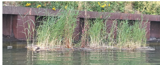
Abb. 2: Schilfgabionen nach Einbau im Mittellandkanal

Im Rahmen des Forschungsprojektes BioSchWelle , welches durch die „Deutsche Bundesstiftung Umwelt“ gefördert wird, soll die Wellendämpfung durch Schilfgabionen erprobt und zusätzlich der Beitrag der Inseln zur Erhöhung der Artenvielfalt in Gewässern bestimmt werden. Standortgerechte und leitbildkonforme Vegetationsstrukturen an Gewässern sind für die Zielerreichung der Umweltqualitätsziele der EU-WRRL sowohl für die biologischen Komponenten als Habitatstruktur als auch für chemisch-physikalische Wasserqualitätsparameter von hoher Bedeutung. Im Rahmen dieses Projektes wurden Naturmessungen mit Schilfgabionen im Mittellandkanal auf der Höhe des Außengeländes „Marienwerder“ durchgeführt und das Verhalten der Gabionen unter Schiffswellen beobachtet. Mithilfe videogestützter Messungen wurden die erzeugten Wellen aus Vorbeifahrten, Begegnung sowie Verfolgungsfahrten verschiedener Sport- und Ausflugsboote sowie von Berufsschiffen aufgenommen. Anhand dieser Datengrundlage soll nun die wellendämpfende Wirkung der schwimmenden Gabionen quantifiziert werden. [ji]